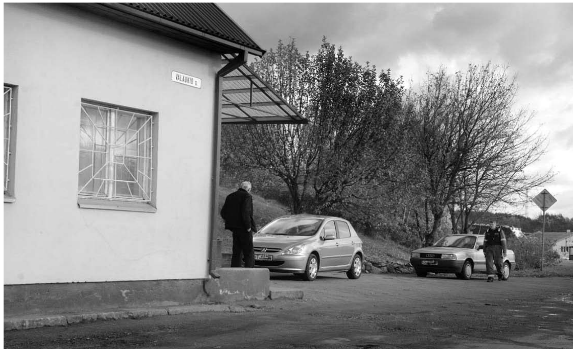
Ankstyvą rytą susipliekę anykštėnai buvo jau gerokai girti.

Šeštadienio rytą Anykščius sukrėtė kruvinas konfliktas. Vairuotojų gatvėje, automobilių stovėjimo aikštelėje, šalia maisto prekių parduotuvės „Vaidlonė“, peiliu sužalotas 45-erių vyrškis.