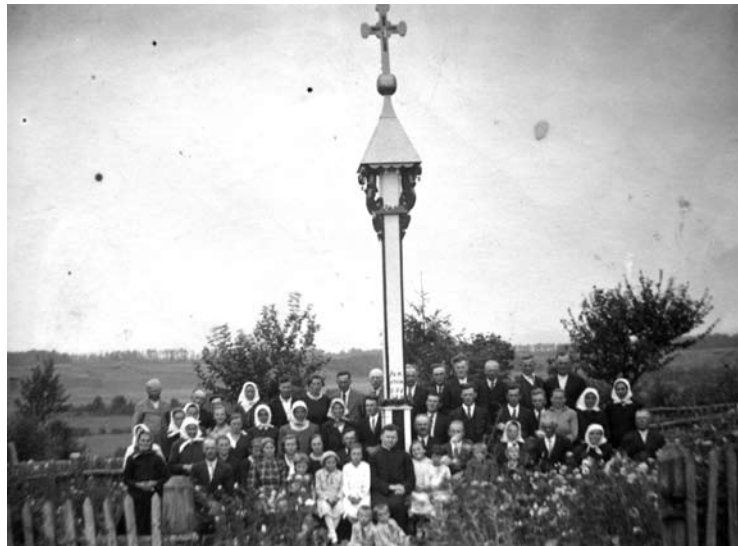
Dagių sodybą tarpukariu papuošė šeiminkų ištikimybę katali-ku tikėjimui įprasminantis originalių formų koplytstulpis.