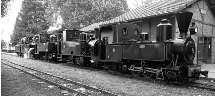
Užsieniečiams turėtų patikti 70 km ilgio arba viena ilgiausių Europoje siauruko trasa ir teatralizuotas traukinio užpuolimas.